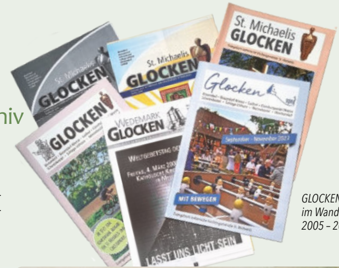
GLOCKEN im Wandel, 2005 – 2024